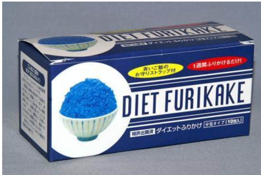
ダイエットふりかけ