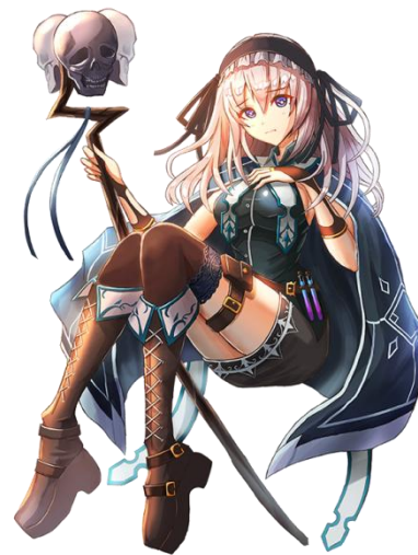
東京コミュニケーションアート専門学校