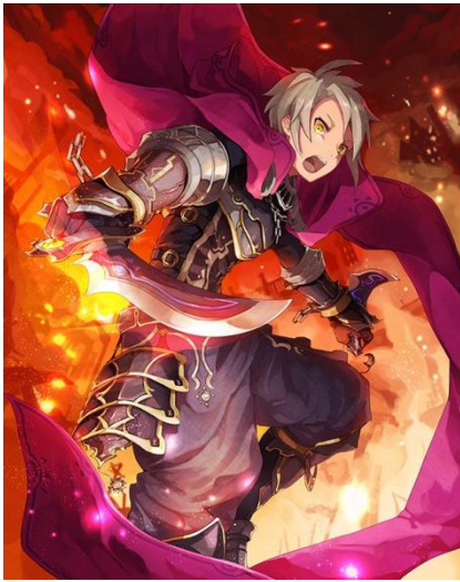
東京ゲームデザイナー学院